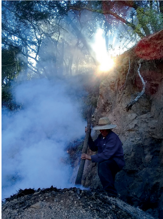
Horno de carbón (5)

porque en un momento pueden hacerlo. Quizás esta latencia en la posibilidad de hacer horno, y no necesariamente la conservación del bosque después de décadas de explotación, es lo que se quiere expresar con la frase "el bosque ahí está".