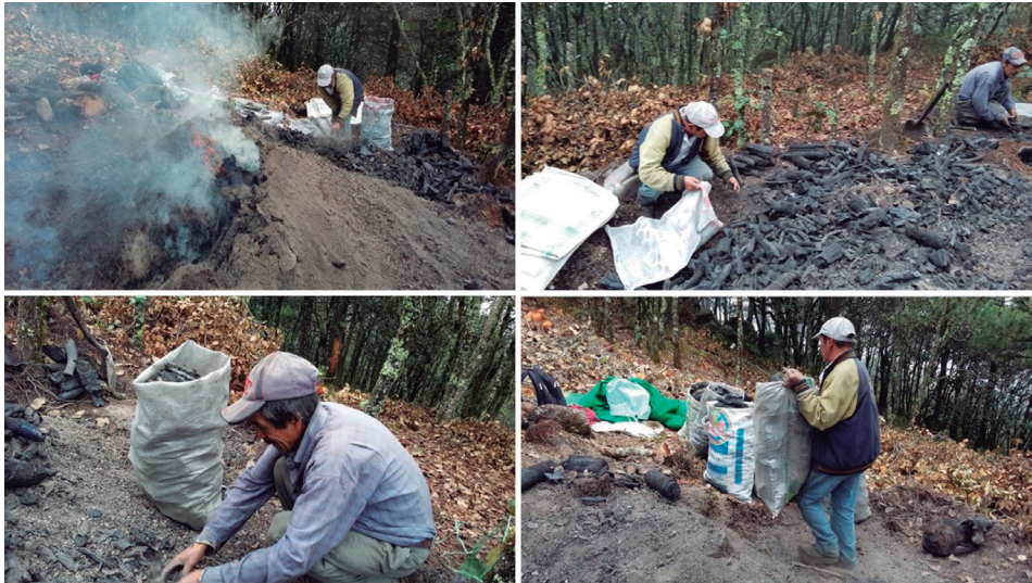
Horno de carbón (3)

El proceso del llenado es lento y cansador. El contacto más directo con el humo y el polvo del carbón ya seleccionado, y de la parte del horno aún encendida, provoca mayor irritación en los ojos. A esa altura la posibilidad de limpiarse no es mucha. Todo: ropa, manos y cara de los carboneros, está cubierto de tizne. De vez en cuando un grito, un quejido o una grosería, anuncia que uno de los carboneros quemó su mano. Ello da pie a bromas y risas que hacen más distendido el proceso de llenado que, en términos generales, se hace de manera muy atenta y silenciosa.