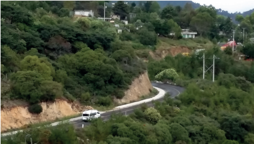
Combi subiendo a la comunidad

Desde que los habitantes de El Boxo bajaron sus viviendas, desde los cerros al ahora denominado centro de la comunidad, para acceder a la energía eléctrica, la fisonomía de la comunidad cambió. El paso de un asentamiento de casas dispersas a un aglomerado en torno a la hoy serpenteante carretera Nicolás Flores-Cardonal, modificó profundamente las formas de habitar el territorio comunitario. 3 Sin embargo, la carretera continúa siendo un espacio ajeno a los habitantes de El Boxo. Es el horizonte que marca el tiempo para saber si pasó la combi o si no tarda en pasar. 4 Gracias a ese horizonte, la mirada casi siempre se adelanta al oído, para advertir la presencia de la combi antes que su conductor toque el claxon avisando, a posibles pasajeros, que ya va de bajada a Ixmiquilpan.