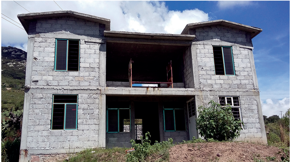
Casa en proceso constructivo, Santuario Mapethé, Hidalgo