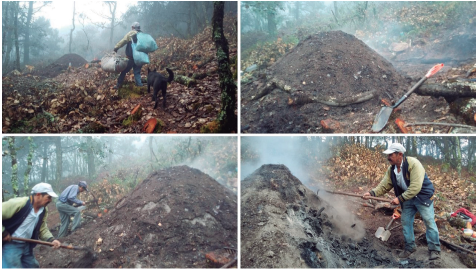
Horno de carbón (2)

Al proceso de sacar el carbón, que implica el desarmado del horno, los carboneros lo llaman quitar lumbre. Ayudados de pala, pico, rastrillo y uña (o hierro de cuatro dedos), los dos carboneros— uno en cada extremo del horno— comenzaron a sacar la tierra y la hojarasca. En este proceso los carboneros van juntando tierra removida, haciendo pequeños montones que les permite ir apagando parte de la hojarasca aún encendida. Luego parecen arar en esos montículos, buscando trozos de carbón. Sobre los trozos de carbón aún rojizos, van esparciendo la tierra que antes separaron en montones, hasta que ya no se perciba lumbre. Con la uña, van juntando el carbón y haciendo una primera selección según el tamaño de los trozos.